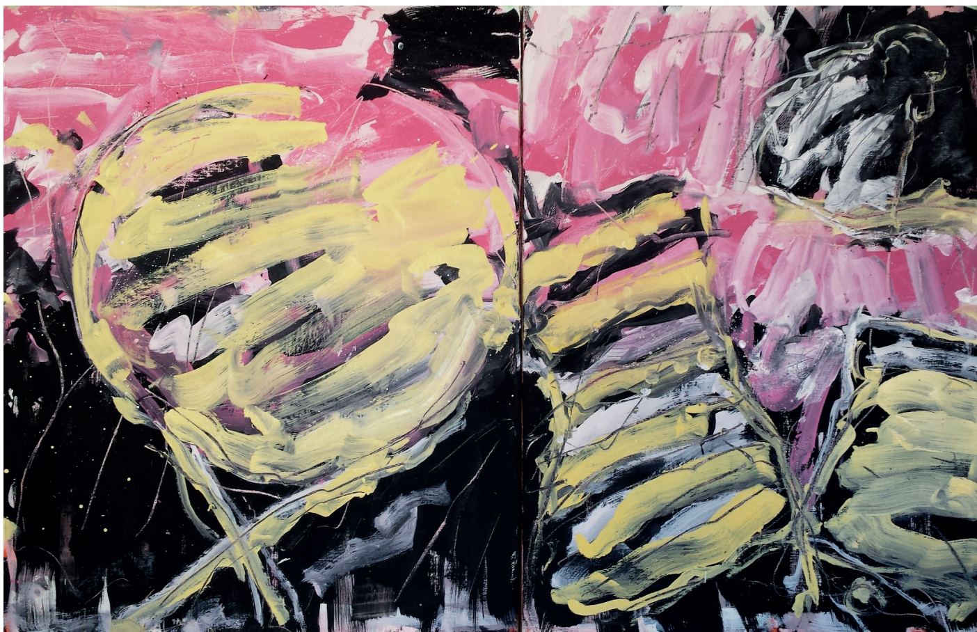
En attendant (table, chaise, à la fenêtre) - huile sur toile - 2019