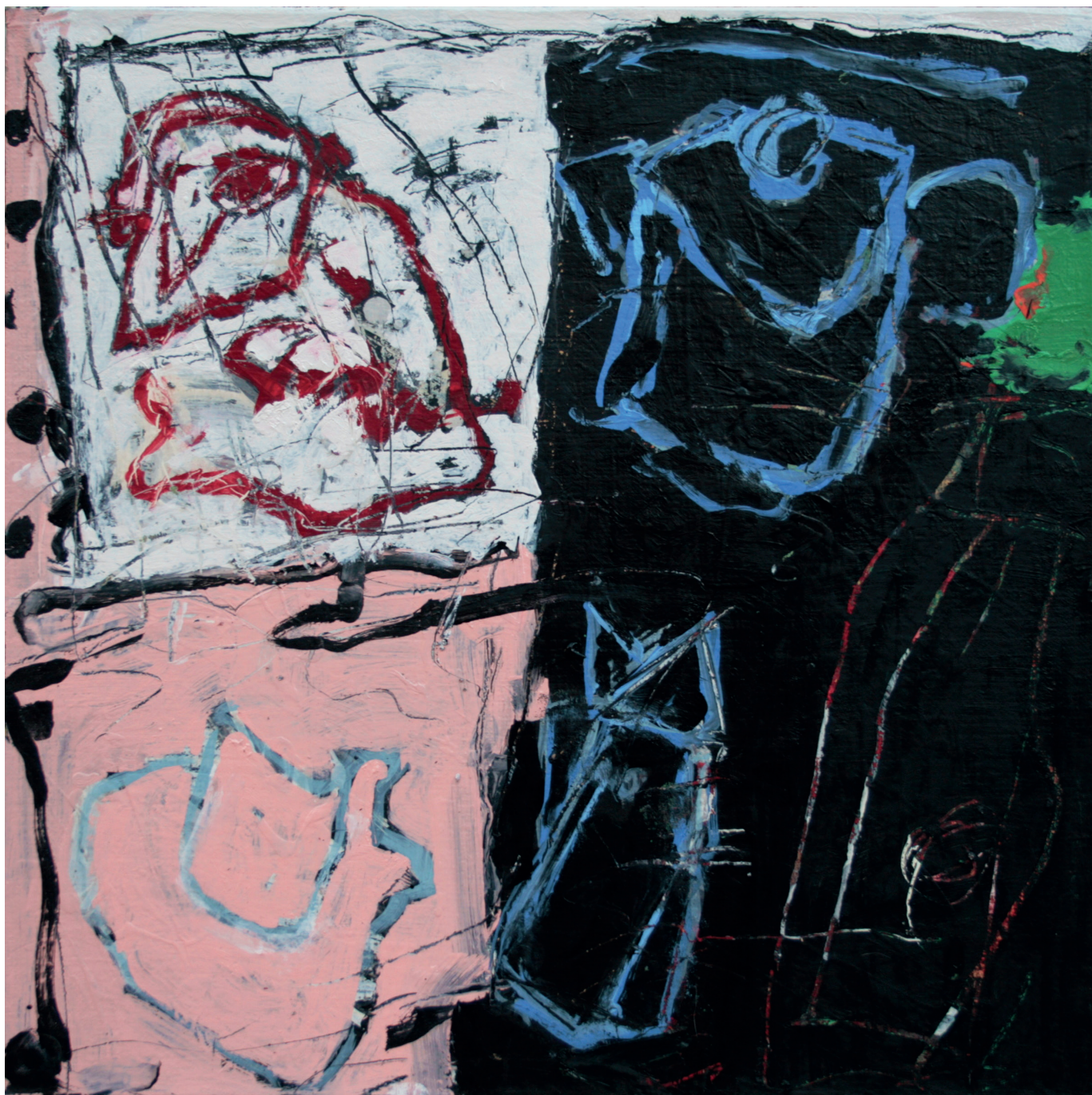
Animalité - huile sur toile - 2020