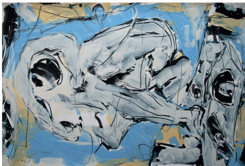
L'amant - huile sur toile - 2020